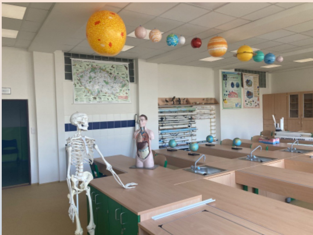
učebna přírodopisu a zeměpisu